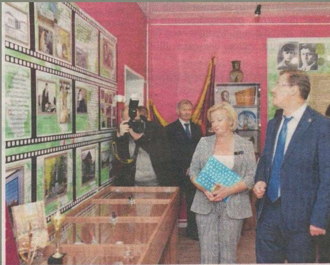
■ В школьном краеведческом музее